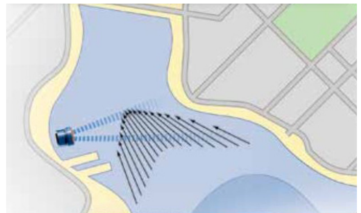
Instalación de ChannelMaster a orillas de un río o en una estructura de la costa para adquirir datos en tiempo real de la velocidad, del nivel y el caudal.