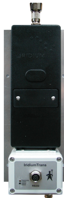
Iridium TRANS Modem

Das Modem ist voll feldtauglich und zeichnet sich durch seine robuste Bauform und geringen Energieverbrauch aus. Auch extremen Temperaturamplituden stellen für das IRIDIUM-Modem kein Problem dar.