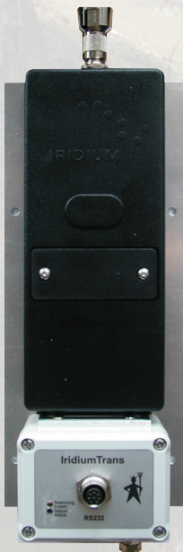
Iridium TRANS Modem